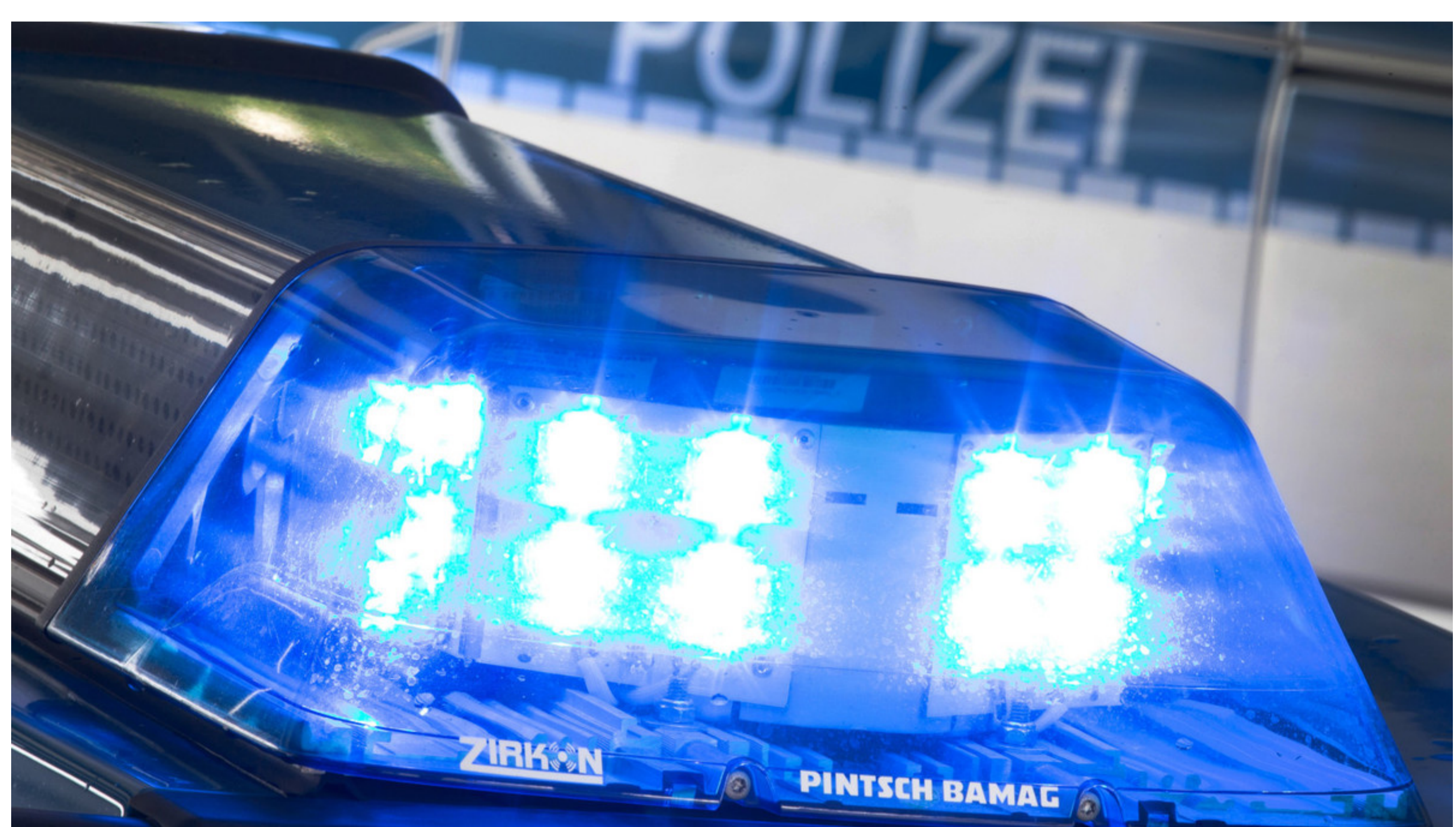
Polizei im Einsatz: Aus einer Betreuungseinrichtung bei Eberswalde ist ein 41-Jähriger verschwunden. Die Vermisstensuche hat zunächst keinen Erfolg gebracht.

Am 31. Dezember 2021 gegen 3:30 Uhr wurde der Polizei der Inspektion Barnim von Mitarbeitern einer Betreuungseinrichtung im Schorfheider Ortsteil Lichterfelde mitgeteilt, dass ein 41-jähriger Bewohner vermisst wird. Dieser hatte die Wohnstätte verlassen und war nicht zurückgekehrt. Eine Eigengefährdung konnte nicht ausgeschlossen werden. Umgehend wurden Suchmaßnahmen eingeleitet.